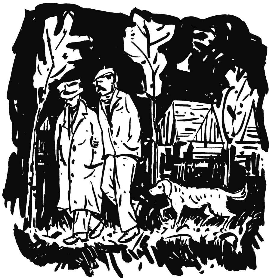
Pes jim byl stále v patách.

Moji malí, milí přátelé! Odevzdejte se do ochrany dobrého Pastýře! On vás ochrání nejen před zlými lidmi, ale také i před hříchem a před mocí a lstí Satana.