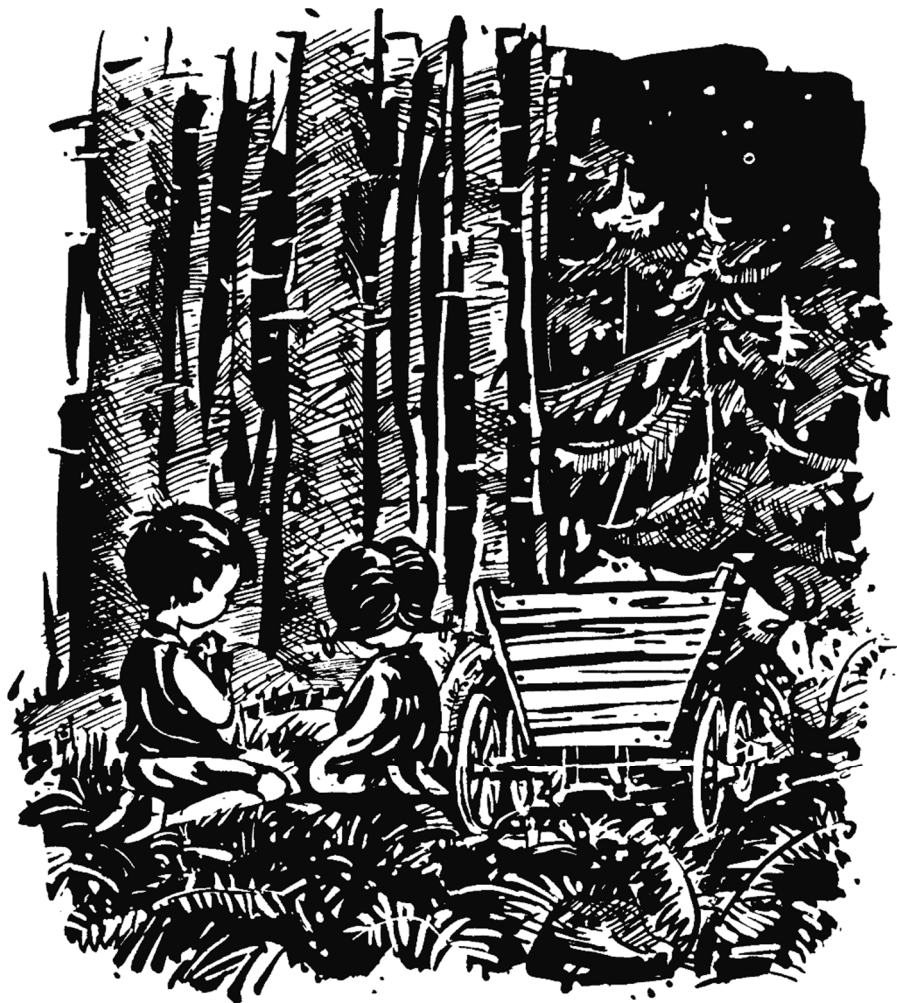
Obě děti si klekly na lesní mech...

„My jsme také byli neposlušní a On to viděl,“ dodal zahanbeně Vašík.